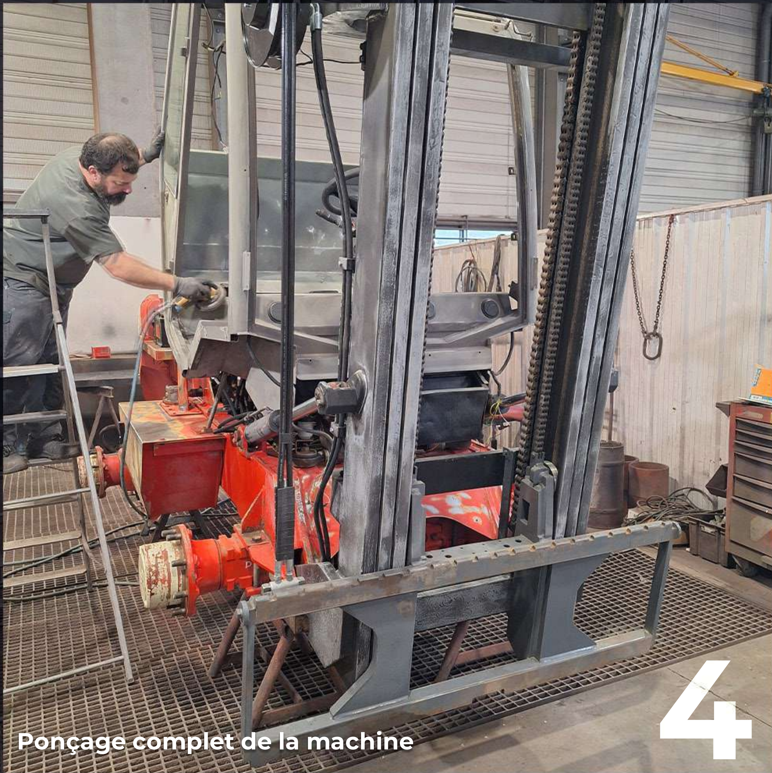
Ponçage complet de la machine