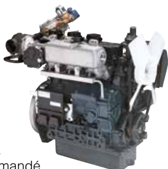
Moteur KUBOTA à allumage commandé