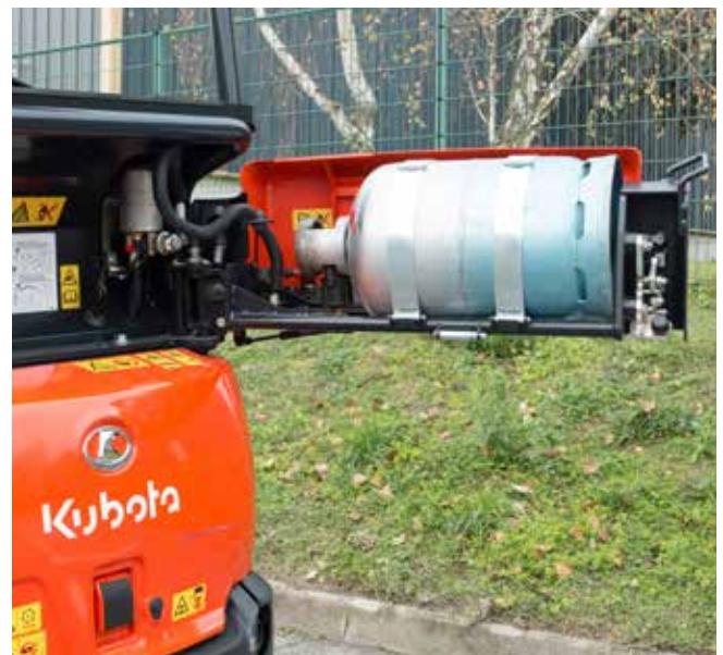
Carburant : Gaz de pétrole liquéfié (GPL)